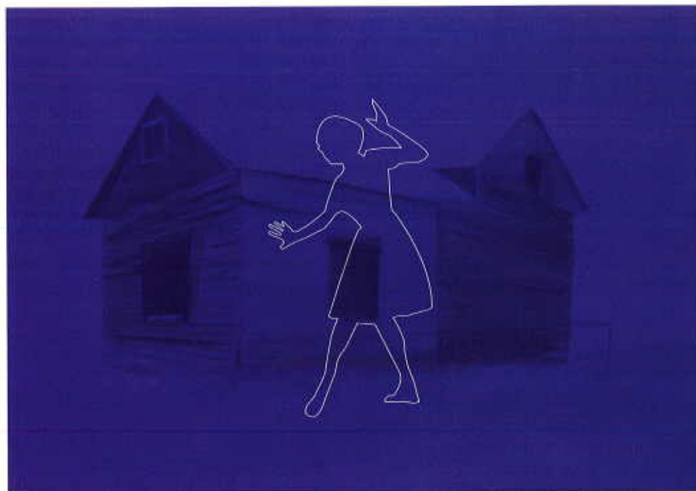
A lato: Inequilibrio , 42x32cm.

6 settembre-6 gennaio, Simone Ponzi, paesaggi , MiniMostra a cura di Ass. MUSE. Bazzano, via Monterosso 2, c/o Agriturismo Il Filare. Inaugurazione: 6 settembre, ore 16.